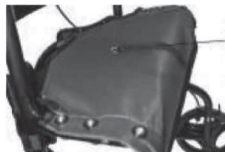
Öffnen des Rollators

Ziehen Sie den Gurt, um den Rollator zu falten